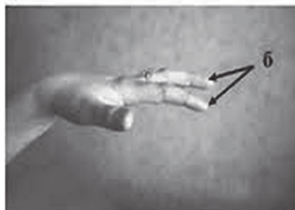
Рисунок 1 – Симптом «рук особи, що молилися».