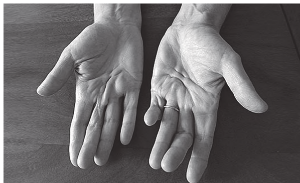
Рисунок 2 – Контрактура Дюпюїтрена.

декомпенсаційного діабету, ускладненого периферійною нейропатією. Клінічними ознаками цієї патології – деформація суглобів стопи (передплесно-плеснових суглобів) і гомілковостопного суглоба; у разі подальшого прогресування патологічного стану в процес можуть залучатися колінні й кульшові суглоби, за рахунок дегенеративно-деструктивних змін середньої частини передплесна відбувається деформація стопи за типом «крісла-гойдалки» [26].